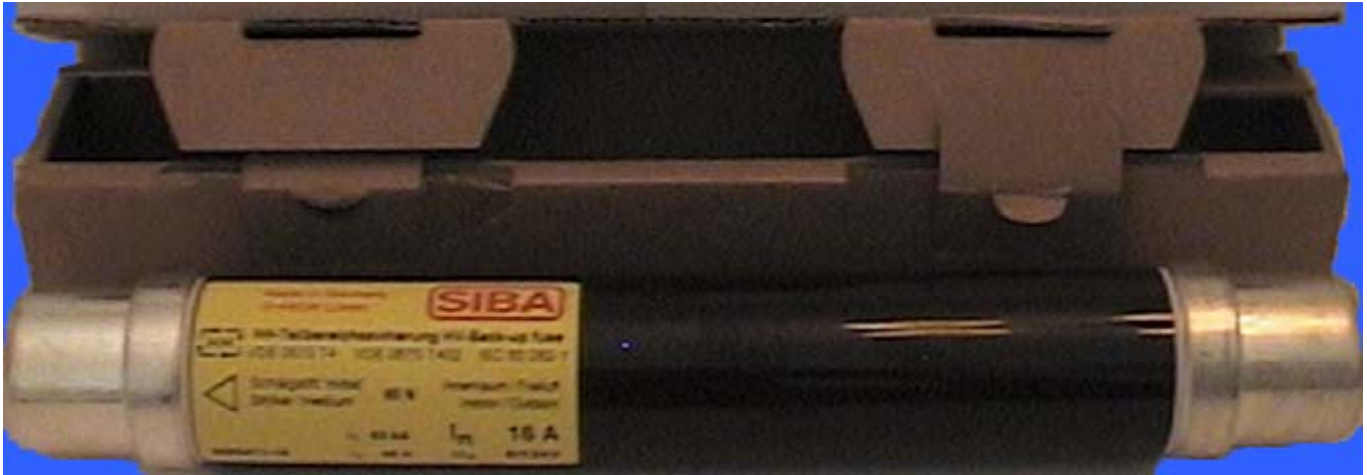
Photo du Fusible