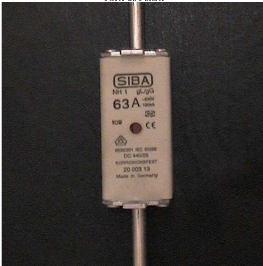
Photo du Fusible