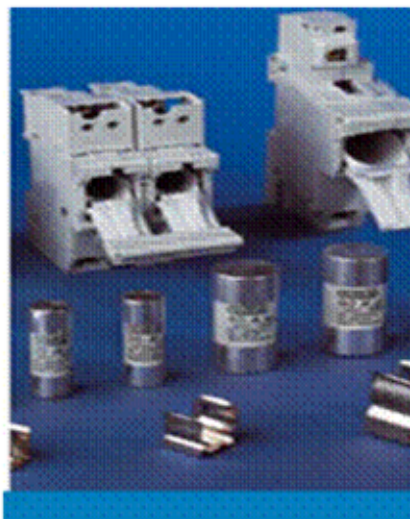
Photo du Fusible